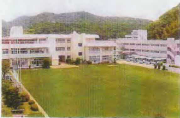
緑の芝生が美しい県立あわじ特別支援学校 (写真はいずれも同校、同校高等部の案内パンフレットより転載)

あわじ特別支援学校の自慢は緑の芝生です。平成21年に地域の方々と一緒に、グラウンドの芝生化に取り組みました。維持がかなり大変で、水が足りずに枯らしてしまう例が多いのですが、本校は幸いなことに地下水がふんだんにあり、維持できています。