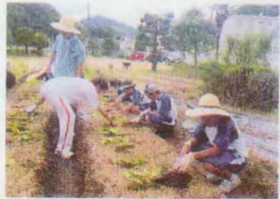
畑作業の実習の様子

本校は五色町にあった淡路特別支援学校と、淡路聴覚特別支援学校が統合して生まれ、8年目になります。淡路唯一の特別支援学校です。教育の対象としているのは、聴覚障害のある幼児、児童、生徒と、知的障害のある（療育手帳を持っている）幼児、児童、生徒ですが、現在、聴覚障害者は在籍していません。他の障害もある子ども、具体的には肢体不自由の子どもを受け入れており、スクールバス7台のうち6台はリフト付きで、車いすを載せることができます。児童生徒数は計88人で、そのうち高等部の生徒が70人を占めます。これは淡路の特徴です。義務教育の間は、地元の小中学校に通わせたいという保護者が多いのでしょうか。