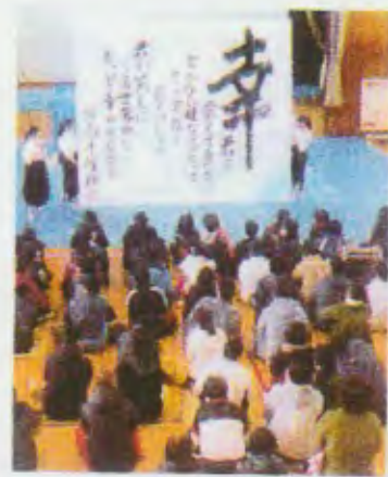
洲本高校と交流の様子

地域の皆さまとも交流しています。ただ、子どもが本校に来ていることを知られたくないという保護者がいます。また、生徒が親、きょうだいと離れて生活しており、きょうだいに居場所を知られたくないといったケースがあり、問題を感じます。