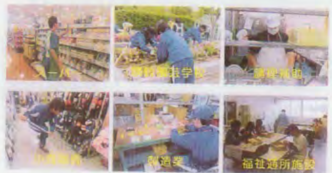
社会参加と自立に向け、高等部ではさまざまな実習に取り組む

特別支援学校がセンター的機能を果たすため、公開講座を開き、教育相談を受け付けています。教育相談は年間500件以上が寄せられています。また、発達検査も行っています。