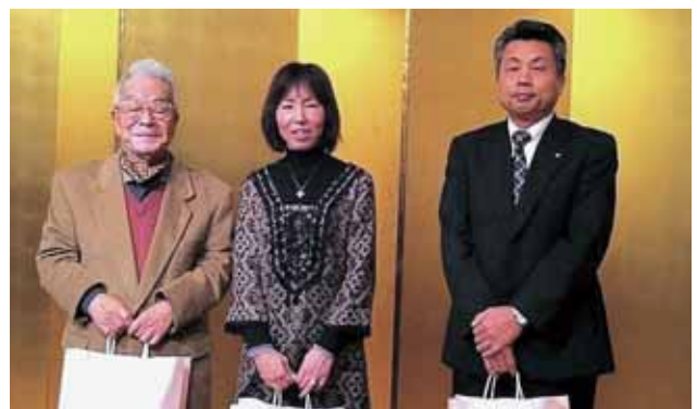
ニコニコ大賞受賞者