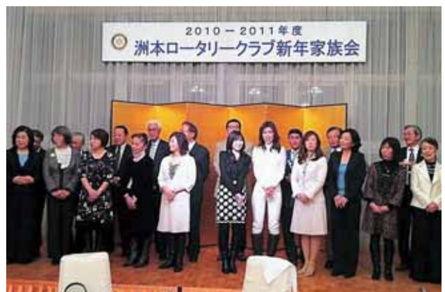
家族仲良くサプライズ