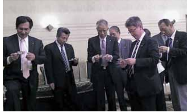
ビンゴ待ちぼうけ